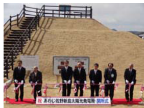
嶋田社長らがテープカット

▶クリハラント/あわじ佐野新島太陽光発電所（兵庫県淡路市）が完成・開所 [2014年3月12日10面]